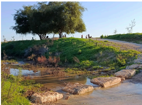
עצי השיזף בנחל תאנים

במסורת הערבית, לכל מקטע בנחל שם אחר, הנקבע לפי אופיו המקומי, לפי הצמחים הגדלים בו, לפי הכפר הסמוך וכן הלאה. ממזרח לגדר ההפרדה, נמצאים המקטעים: ואדי אירתח (על שם הכפר הסמוך), ואדי א-תין (בין כפר כור לאבני חפץ, נחל תאנים), ואדי יאקוב (על שם יעקב, לא ברור אם בעל אדמות מהאזור או על שם יעקב אבינו), ואדי אל קאדי (השופט), ואדי אל אוקדה, ואדי אל חרובה (על שם החרובים הגדלים סביב), ואדי אל חסאנייה, ואדי אן-נוקעה. המקטע שאנו עוסקים בו במישור החוף נקרא בפי הערבים ואדי עספור - על שם צמח מקומי ששימש בעבר תחליף פשוט לזעפרן היקר. ועדת השמות הישראלית אימצה דווקא את השם ואדי א-תין, עיברתה אותו לתאנים והחילה את השם על מלוא אורכו של הנחל.