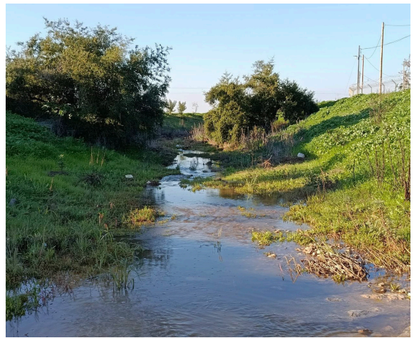
נחל תאנים

בחניון השיזף גדלים שני עצים הסמוכים זה לזה ונושקים בצמרת, ובצילם שולחן פיקניק נגיש. מכאן יוצא שביל מצע מהודק ופונה מזרחה במעלה הנחל. בדרכנו, נראה ריכוז של עשרות עצים ושל שיחי שיזף מצוי בשולי שדות חקלאיים בשתי גדותיו של נחל תאנים. עצי השיזף יוצרים נוף של סוואנה, וזהו הריכוז הגדול והצפוני ביותר של עצים אלו במישור החוף.