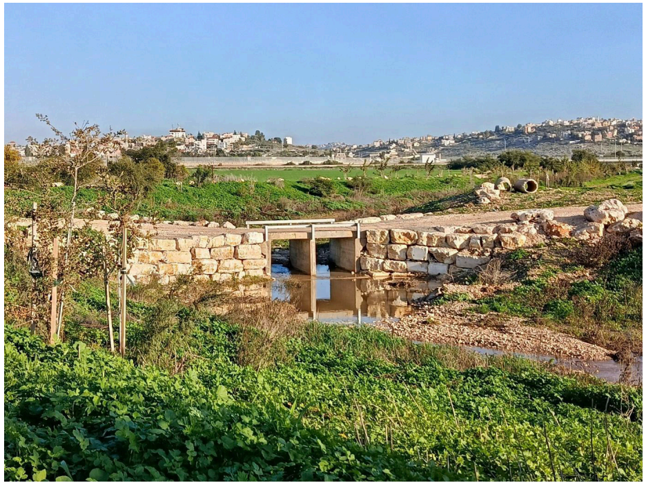
מבט אל נחל תאנים

הגשר הטורקי נבנה על גבי שש אומנות, אבן מרשימות, מדרום להן נבנו שלוש קשתות. המכלול כולו בנוי על בסיס מוגבה היוצר מעין סכר שדרכו נחל תאנים זורם במפל קטן. אזור הגשר גדוש צמחייה. הגשר הוא גולת הכתר של הטיול בנחל. מזרחית לגשר, מעבר לגדר הפרדה, נמצא אתר